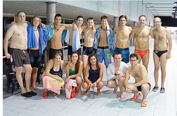
Démo à Bellinzona club des sauveteurs

Août voit la première couverture télé nationale pour le Hockey sub Aquatique Suisse, avec la visite en juin de la première chaine nationale SRF1 à la piscine d'Oerlikon, le fief des Wahoos Hockey subaquatique Zurich. Semblant d'abord assez intimidée, la présentatrice, Annina Frey, plonge bientôt la tête la première (littéralement) et prend goût à ce sport très rapidement. Elle a même marqué un but à la fin de la session, mais le cameraman n'étant pas là, le but a dû être rejoué.