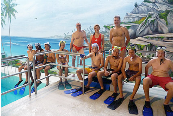
Démo à l'école Wallisellen, Zurich

Nous avons également organisé des manifestations à l'école de Wallisellen dans le canton de Zurich et au club de sauvetage SSS à Bellinzona. La réponse du groupe de Bellinzona était particulièrement encourageante, et ils ont déjà demandé quatre autres manifestations dans la première partie de l'année 2016.