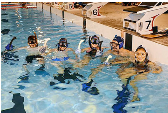
Le groupe Genève/Annemasse grandit!

L'équipe de Genève, une partie du club de plongée Exocet Lemans d'Annemasse, en France, a connu une croissance rapide, et est passée de quelques personnes au début de l'année à quatorze joueurs à la clôture. Ses joueurs viennent de France, Suisse, Portugal, Afrique du Sud et la Pologne. Le club est multiculturel et multinational, avec une tranche d'âge de 15 à 40 ans.