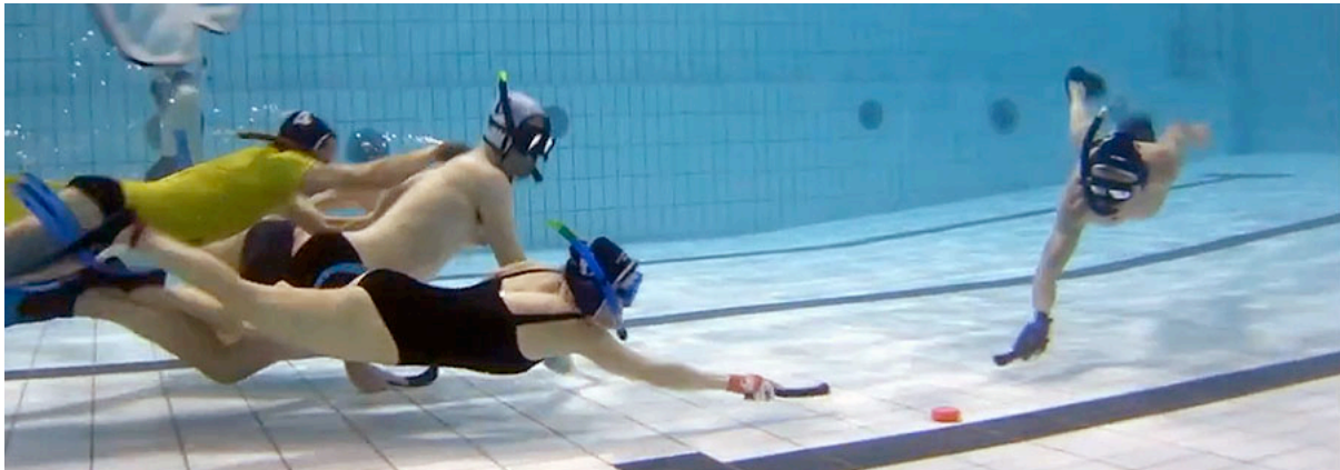
HSA Bâle fait une démonstration de Hockey au club de plongée des Trois Frontières section nage avec palmes

La nouvelle équipe de Bâle - une collaboration avec le club de plongée Plongée des Trois Frontières à Huningue, France - a connu une croissance constante au cours de 2015. La fréquentation qui était de 2 vs 2 au début de l'année, a augmentée à 4 vs 4 et même un 5 vs 5 vers la fin de l'année. L'avenir semble prometteur pour le hockey subaquatique à Bâle en 2016, et je voudrais personnellement remercier Thomas Lapointe et Frédéric Ruiz pour leur soutien sans faille dans cette aventure.