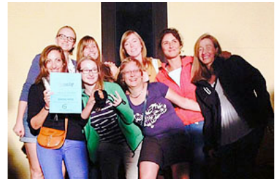
l' équipe feminine à Parme

En local, nous avons poursuivi nos efforts pour développer ce sport en organisant des manifestations à travers la Suisse. Nous avons à nouveau mis en place un stand à l'occasion de « la nage annuelle Reusschwimmen » de la rivière et distribué de nombreux flyers.