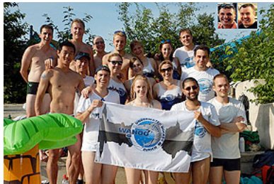
Wahoos à Munich

Deux autres tournois majeurs suivent pendant l'été: le tournoi de Munich Beer n 'Brez'n à Peissenberg, Allemagne et la Parmacup à Parme, en Italie. Pour ces deux tournois nous avons aligné deux équipes, Elles se classent 6 èmes et 11 èmes sur 12 à Munich, et à Parme les hommes finissent 17 èmes sur 20 et les filles finissent 6 èmes sur 7.