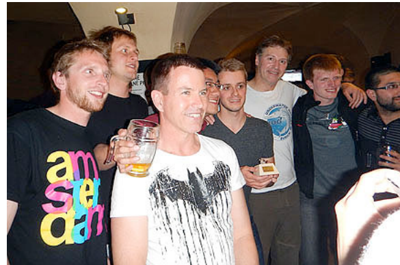
La première équipe Suisse qualifié pour la division supérieur dans un tournoi multi division

Le prochain tournoi, à Mulhouse, France, très attendu puisque nous nous y préparons depuis maintenant 7 ans: Et c'est une victoire ! Avec 64 buts marqués et zéro encaissé, en cinq matchs, ce fut une performance exceptionnelle. Une fois de plus, nous avons pu aligner une équipe féminine, qui, bien qu'ayant terminé à la dernière place, était la seule équipe féminine du tournoi, et a quand même réussi à marquer deux buts contre l'équipe masculine de Mulhouse (deuxième place au classement général).