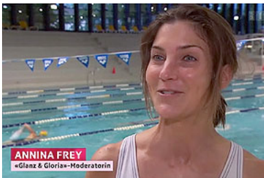
Annina de SRF1 essaye le Hockeysub

Août voit la première couverture télé nationale pour le Hockey sub Aquatique Suisse, avec la visite en juin de la première chaine nationale SRF1 à la piscine d'Oerlikon, le fief des Wahoos Hockey subaquatique Zurich. Semblant d'abord assez intimidée, la présentatrice, Annina Frey, plonge bientôt la tête la première (littéralement) et prend goût à ce sport très rapidement. Elle a même marqué un but à la fin de la session, mais le cameraman n'étant pas là, le but a dû être rejoué.