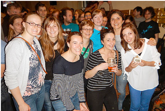
La toute première équipe Féminine Suisse