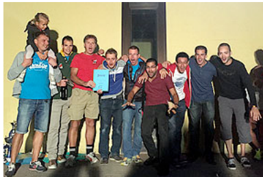
l' équipe masculine à Parme