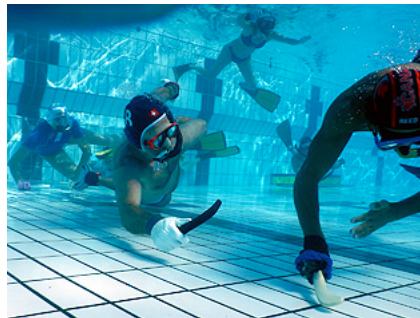
Pratica di nuove tecniche