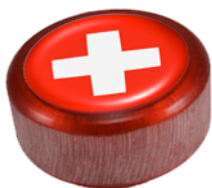
Hockey Subacqueo Svizzera www.hockeysub.ch

Rappresentante, Hockey Subacqueo Presidente della commissione sportiva Federazione Svizzera di Sport Subacquei