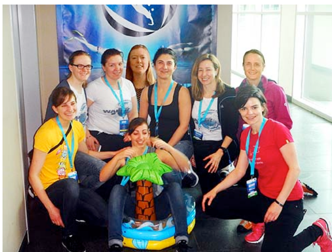
La prima squadra donne da Svizzera a Euroclubs

In entrambi i tornei le squadre sono arrivate ultime, ma l'esperienza è stata ottima, soprattutto per profilare i nuovi giocatori.