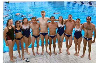
8° posto a Budapest, Ungheria