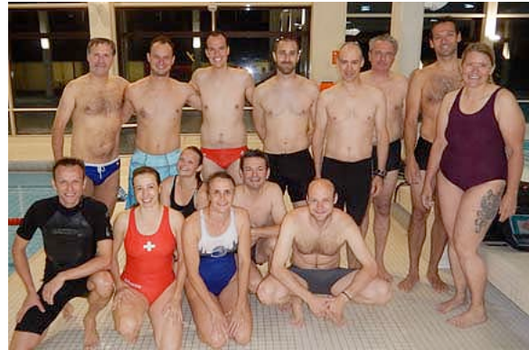
Dimostrazione di Hockeysub a Berna (BE)

Come di consueto, a Tenero in Agosto si è tenuto il nostro campo d'allenamento con la partecipazione di oltre 25 giocatori provenienti da tutta la Svizzera, alcuni dalla Germania ed un allenatore Francese come ospite.