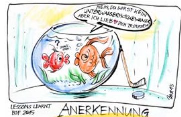
Il punto di vista di HS di BSF

La presentazione di Martin Reed allo Sport Forum di Berna (BSF) nel Novembre 2015 ha portato ad una collaborazione con Bernsport, l'organo per lo sport nel Canton Berna, al fine di introdurre e promuovere questo sport nell'ambito di Bernsport.