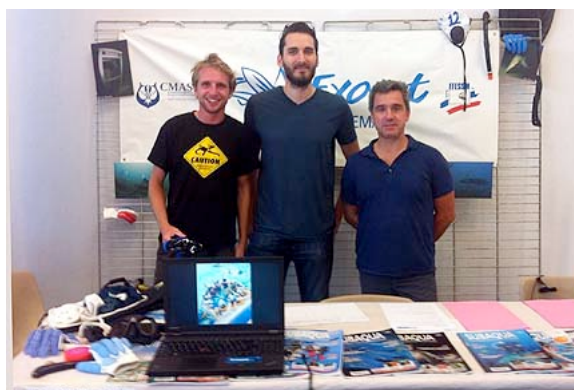
HS al giorno "associazione sportive" di Annemasse