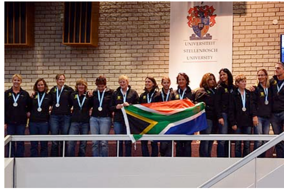
Leigh (seconda da sinistra): argento nel Master delle Donne

E 'stata una bella riunione di squadra Suisse e Leigh ha celebrato l'occasione vincendo una medaglia d'argento nella sua divisione.