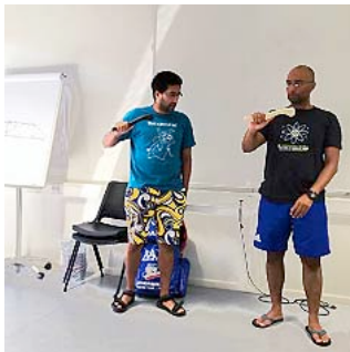
Krishna impara una nuova tecnica

Come di consueto, a Tenero in Agosto si è tenuto il nostro campo d'allenamento con la partecipazione di oltre 25 giocatori provenienti da tutta la Svizzera, alcuni dalla Germania ed un allenatore Francese come ospite.