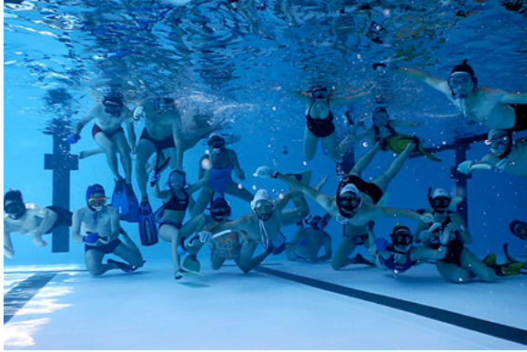
Dimostrazione di Hockeysub a Annemasse a Luglio