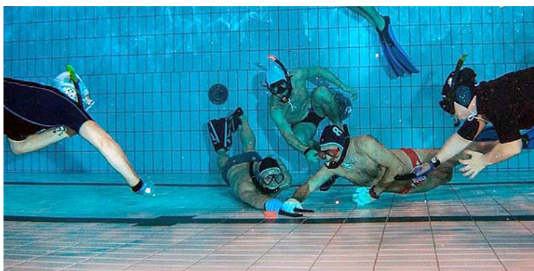
Club serate di Hockey Subacqueo gruppo di Basilea: è tutto azione!