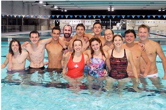
Dimostrazione di Hockeysub a Bellinzona (TI)

Inoltre, abbiamo tenuto dimostrazione al SLRG club di Bellinzona (TI) e presentato l'Hockey Subacqueo al gruppo apnea del TSGB dive club di Berna (BE).