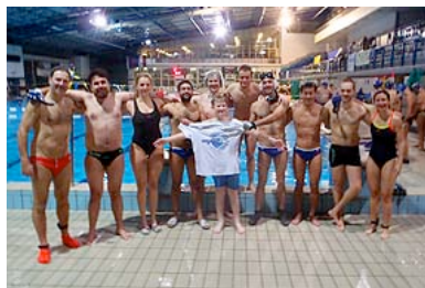
10° posto a Kranj, Slovenia