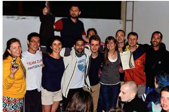
I vincitori del torneo di Monaco di Baviera, Giugno 2016

L'Hockey Subacqueo Svizzero ha inoltre marcato presenza in Europa partecipando al torneo invernale di Grenoble (Francia), al long-running Memorial Mesareca torneo di Kranj (Slovenia) e con una prima apparizione all'inaugurale torneo internazionale di Budapest (Ungheria).