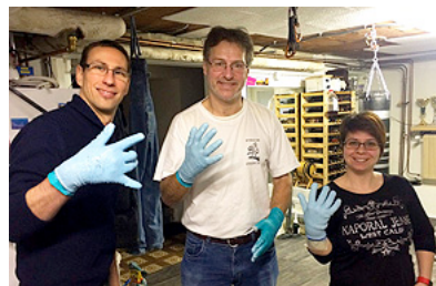
Rendendo i propri guanti