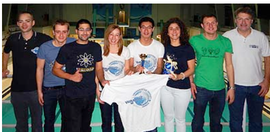
2° posto a Torino, Italia

Abbiamo chiuso l'anno partecipando al terzo torneo "Il Gianduiotto" di Torino (Italia). Sebbene il primo incontro contro i vincitori H.S. Ducale di Parma è stato perso, abbiamo vinto le restanti partite, ivi inclusa la combattuta partita contro il Monaco, finendo così secondi fra otto squadre partecipanti.