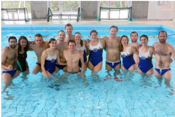
I vincitori del torneo di Mulhouse, Maggio 2016

Tuttavia, abbiamo potuto ripetere il successo di Mulhouse del 2015 portando a casa la stessa vittoria a Maggio 2016. Un mese più tardi è seguita la vittoria al torneo di Monaco di Baviera, un miglioramento di due posti rispetto al precedente terzo posto nel 2013.