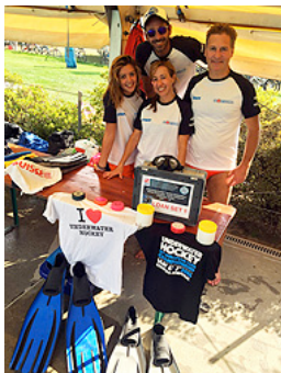
Aperto per affari!

Dopo una giornata di pioggia nel 2015, siamo stati felici di tornare alla "normalità" con sole a picco e cielo azzurro, ciò che avevamo già sperimentato nel 2014.