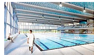
Piscina programmato a Sursee

Siamo stati inoltre invitati a partecipare e contribuire alla progettazione di un nuovo centro sportivo nazionale a Sursee, nei pressi di Lucerna, al fine di rendere gli sport subacquei più simpatici.