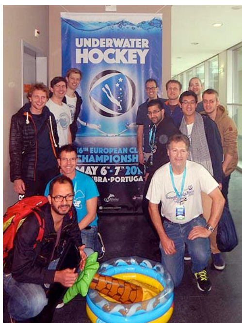
La prima squadra uomini da Svizzera a Euroclubs

2016 è stato l'anno in cui l'Hockey Subacqueo Svizzero ha fatto un altro gran passo in avanti, con la prima presenza in assoluto - con squadra maschile e femminile - ai Campionati Europei di Club a Coimbra (Portogallo) a Maggio ed al lung-running torneo di Argonauta a Breda (Olanda) a Settembre.