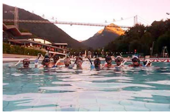
Il "derby" con i Morzines

A livello nazionale, tre donne del Ginevra-Annemasse si sono unite alla squadra del Leone qualificandosi per la seconda divisione dei campionati nazionali Francesi ed arrivando quarti su dodici squadre. Inoltre quattro uomini del Ginevra-Annemasse si sono uniti alla seconda squadra di Grenoble mancando però l'obiettivo di qualifica ai campionati Francesi. Tuttavia, le aspettative sono grandi e la squadra è pronta per altre sfide nel 2017.